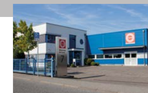
RINGSPANN RCS GmbH, 德国 远程控制系统工厂