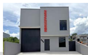
RINGSPANN do Brasil Ltda., 巴西