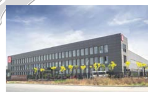
RINGSPANN Power Transmission (Tianjin) Co., Ltd., 中国