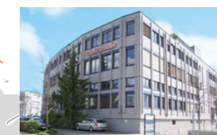
RINGSPANN Turkey Tic. Ltd. Şti., 土耳其