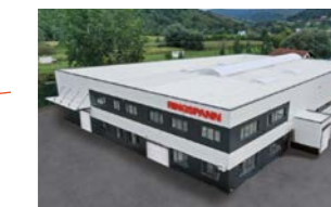
RINGSPANN Bosanska Krupa d.o.o., 波黑共和国