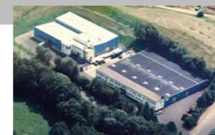
RINGSPANN Kempf GmbH, 德国 万向轴制造基地