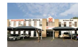
RINGSPANN South Africa (Pty) Ltd., 南非