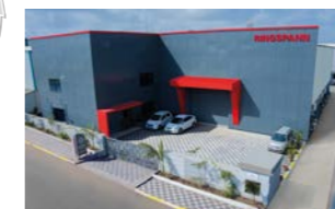
RINGSPANN Power Transmission India Pvt. Ltd., 印度