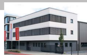
RINGSPANN GmbH, 德国 制动器, 联轴器, 精密夹具, 轴-套无键连接器制造基地