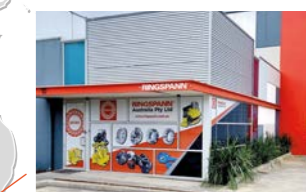
RINGSPANN Australia Pty Ltd, 澳大利亚