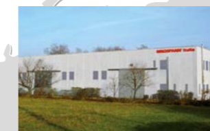
RINGSPANN Italia S.r.l., 意大利