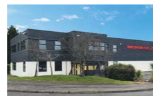
RINGSPANN (U.K.) LTD., 英国