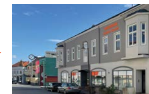
RINGSPANN Austria GmbH, 奥地利