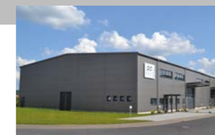
RINGSPANN StS GmbH, 德国 精密联轴器工厂