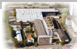
RINGSPANN GmbH, 德国 总部, 离合器制造基地