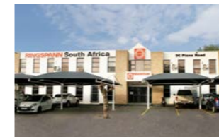
RINGSPANN South Africa (Pty) Ltd., Güney Afrika