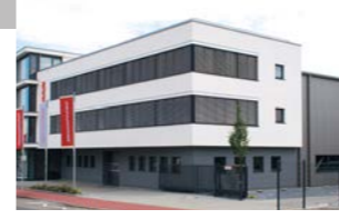
RINGSPANN GmbH, Almanya Frenler, Kaplinler, Sıkıştırma Fikstürleri ve Konik Kilit Sistemleri Fabrikası