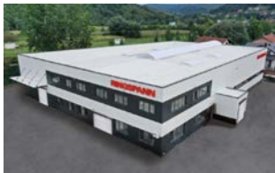
RINGSPANN Bosanska Krupa d.o.o., Bosna Hersek