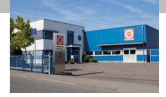
RINGSPANN RCS GmbH, Almanya Mekanik Uzaktan Kontrol Sistemleri Fabrikası