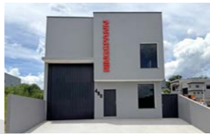
RINGSPANN do Brasil Ltda., Brezilya