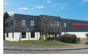
RINGSPANN (U.K.) LTD., Büyük Britanya