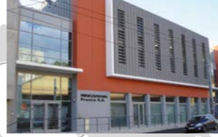
RINGSPANN France S.A., Fransa