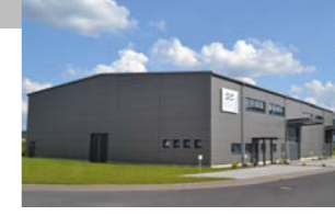
RINGSPANN StS GmbH, Deutschland Tesis Hassas Bağlantı Elemanları