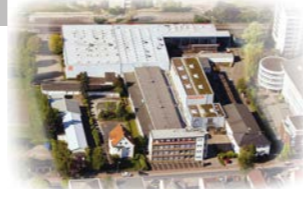
RINGSPANN GmbH, Almanya Genel Merkez ve Tek Yönlü Kavramalar Fabrikası

Tek Yönlü Kavramalar Frenler Şaft-Göbek Bağlantıları Ağır hizmet tipi kaplinler Endüstriyel Kaplinler Hassas Kaplinler Hassas Sıkıştırma Aparatları Uzaktan Kontrol Sistemleri