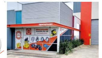
RINGSPANN Australia Pty Ltd, Avustralya