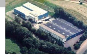
RINGSPANN Kempf GmbH, Almanya U-Mafsallar Fabrikası