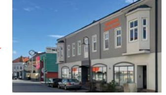
RINGSPANN Austria GmbH, Avusturya