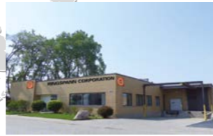
RINGSPANN CORPORATION, USA