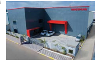
RINGSPANN Power Transmission India Pvt. Ltd., Hindistan