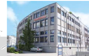
RINGSPANN AG, İsviçre