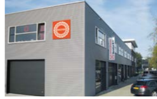
RINGSPANN Benelux B.V., Hollanda